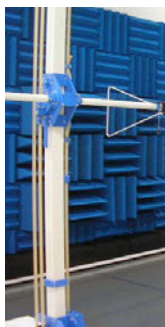
見学する試験サイト内部の様子 （平成23年4月供用開始）