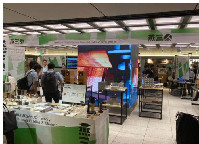
JRE Local Hub 燕三条 in Tokyo Station