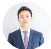
取引先など (発信者)

「架電内容の要約」と「誰から誰宛ての電話か」を チャットで担当者に自動通知する仕組みを構築