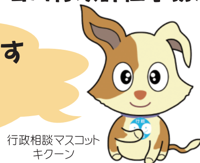
行政相談マスコット キクーン