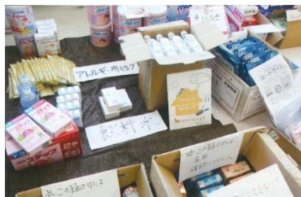
物資拠点の様子（アレルギー対応支援活動の記録（ひだまり作成）より）