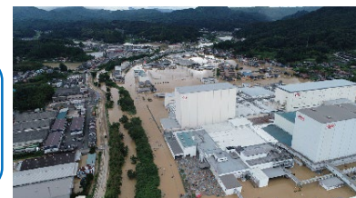
被災の様子

食物アレルギー疾患を有する者から、「避難所に食物アレルギー対応の食品がない」、 「物流が停滞し、食物アレルギー対応の食品が手に入らない」との声あり